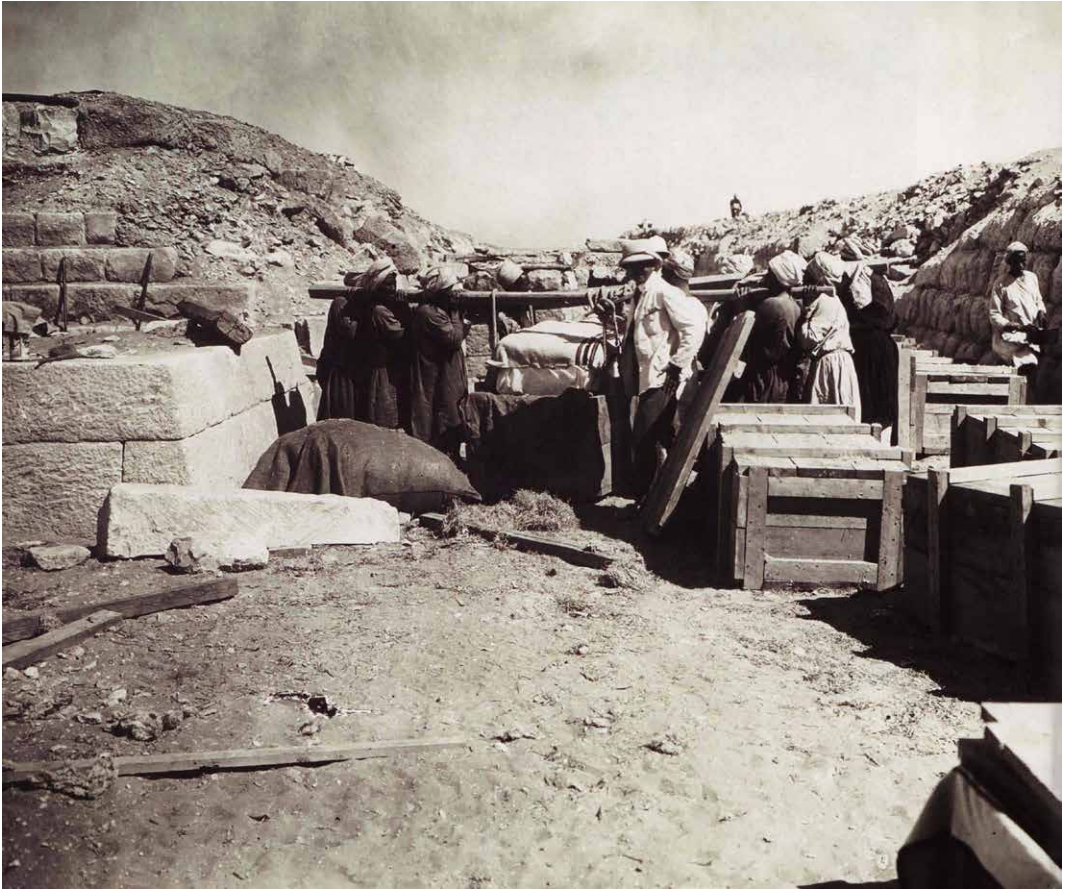
↑ Afb. 3 Het ontmantelen van de cultuskapel van Kaninisut in Giza in 1914.

pakket arriveerde in juli 1914. Door tussenkomst van de Eerste Wereldoorlog kon het echter pas in 1925 aan het publiek worden getoond (afb. 3). 4 Wie weet bezocht Herta toentertijd de mastaba met haar gymnasiumklas, zoals scholieren nu de grafkapel van Hetepherachty bewonderen in Leiden.