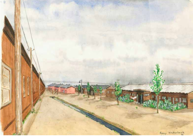
← Afb. 9

Aquarel van Kamp Westerbork, met rechtsvoor de barak waar Herta met haar ouders heeft gewoond. Maker: Otto Birman.